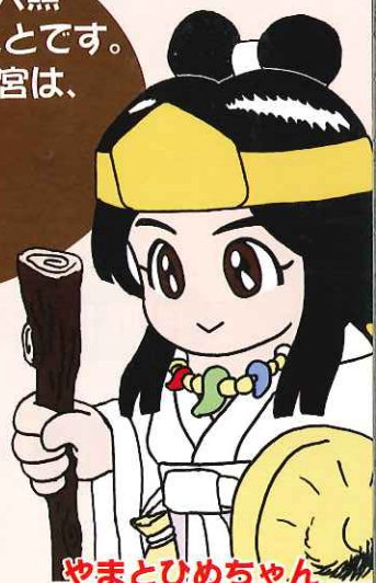
やまとひめちゃん © 伊勢あんちょこの会

飛鳥浄御原宮とは、飛鳥時代に天皇が住んでいた都のこと。 斎王とは、天皇に代わって天照大神に仕えたお姫さまのことです。 お姫さまの住んだお宮は、「斎宮」といって、今の明和町にあったんですよ！