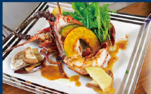
伊勢外宮参道料理店 鉄饅