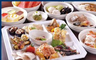
レストラン勾玉亭(勢乃国屋 豊恩館) バイキング

☎0596-22-7788 休水曜日・第2・第4火曜日 営業18:00~21:00(LO.20:00)