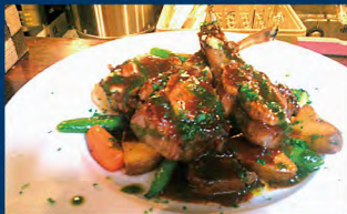
伊勢外宮参道ビストロ&バー Queen Diner(クイーン・ダイナー)