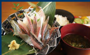
鈴木水産 外宮参道店