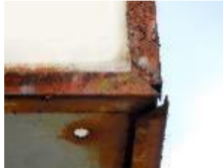
表示面板押さへのさびが進行した状態