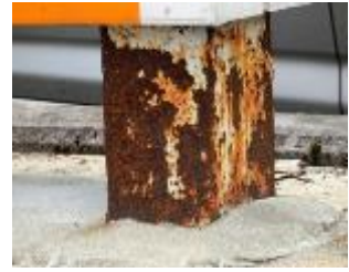
支柱根元の腐食が進行した状態