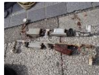
変圧器（トランス）のさびが進行した状態