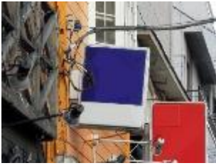
上部構造全体が傾斜した状態