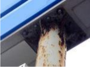
接合部（溶接部）が腐食している状態