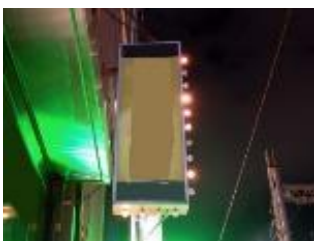
ランプ球の一部が不点灯の状態