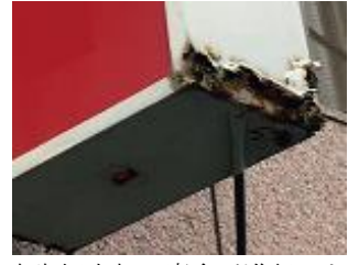
広告板底部の腐食が進行した状態