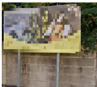
自家用広告物（敷地内看板）の例