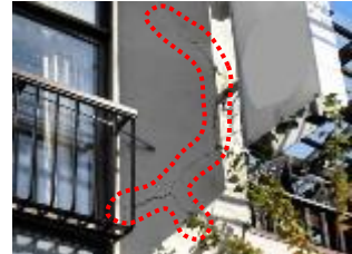
壁面にひびが生じた状態