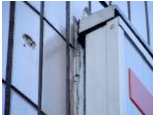
コーキングが劣化した状態