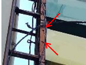
ボルトのゆるみや欠落した状態