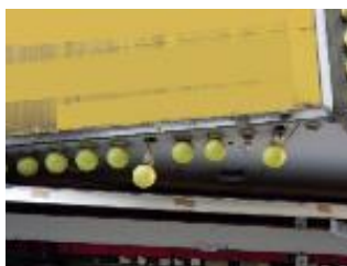
ソケットが垂れ下がった状態