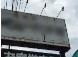
表示面の継ぎ目からさびが垂れた状態