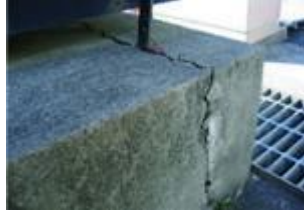
基礎にクラックが入った状態