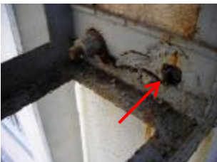
所定の場所にアンカーボルトがない状態