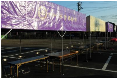
▲外宮奉納市オリジナルテント